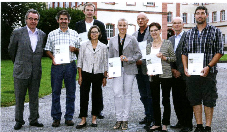
Initiatoren und Preisträger des Gestaltungswettbewerbs „Santuro sucht den Super-Garten“.