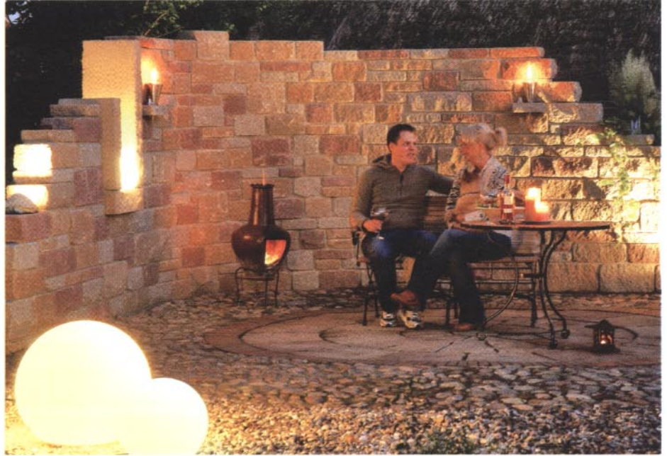
Kugelleuchten und Fackeln setzen stimmungsvolle Akzente. | Foto: Carstensen.