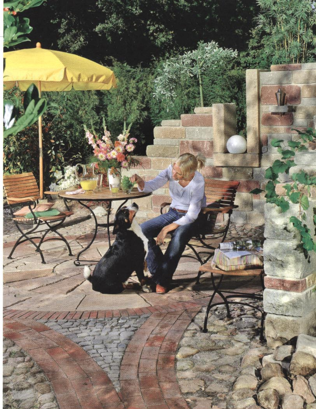
Harmonie von Beton- und Naturstein.

Der entscheidende Vorteil der Santuro-Steine für den Verarbeiter im Vergleich zu Natursteinen ist die Tatsache, dass deren Lagerflächen flach sind. Dadurch erhält man beim Mauern immer eine gerade und gleichmäßige Fugenlinie. Alle Santuro-Steinformate werden maßhaltig für den Bau einer Trockenmauer (ohne Fugen) gefertigt. Das bedeutet für ein unregelmäßiges Wechselschichtmauerwerk, dass sich un-