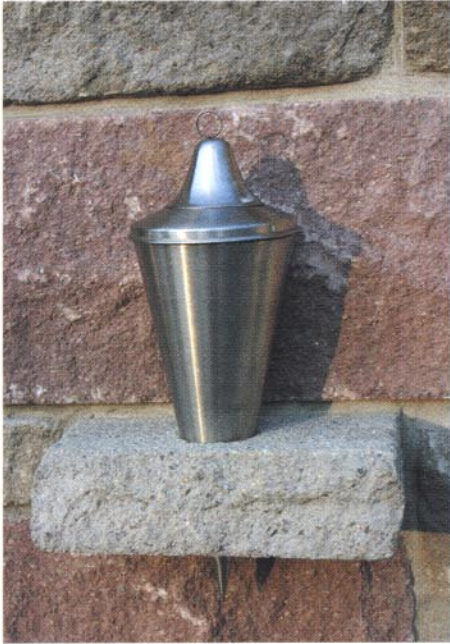
Die Fackelhaltersteine wurden speziell für das Projekt angefertigt, was die Flexibilität des Herstellers unterstreicht.