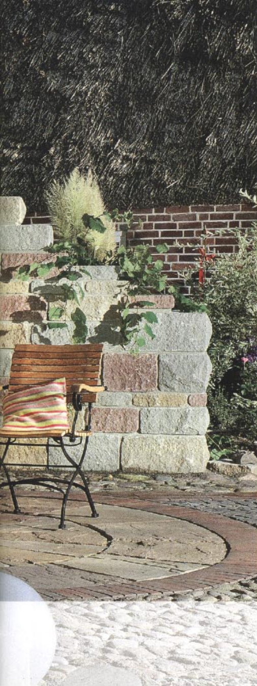
Sichtschutz-Mauer im mediterranen Stil.

machen, empfiehlt es sich, alle unterschiedlichen Steine auszulegen und Stein für Stein laut Aufbauplan auszusuchen. Vor dem Vermauern sollten einige Steine einer Schicht probeweise aufgelegt werden. Dabei kann mit den Steinfarben - Naturgrau, Jurabraun, Schilfsand und Rot-Buntsandstein – je nach Geschmack variiert werden. Hier gilt: In der Vielfalt liegt das stimmige Gesamtergebnis! Unschön wäre es, denselben Farbton an einer bestimmten Stelle zu oft zu wiederholen.