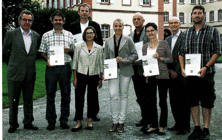
Bei der Preisverleihung auf der Insel Mainau: Veranstalter und Preisträger des Gestaltungswettbewerbs „SANTURO® sucht den Super-Garten“.

Grimm garten gestalten (Hilzingen). Der 2. Preis ging an das Büro David J. Elsworth, Garten- und Landschaftsarchitekten (Stuttgart). Den 3. Preis erhielt das Unternehmen Carsten Wellner Garten- und Landschaftsbau (Neustetten). Das Wettbewerbsergebnis basiert auf herausragenden Anwendungen der Produktlinie SANTURO® Mauerkultur in Hausgärten. Die Bewertung erfolgte nach den Kriterien Gestaltungsidee, Funktion, Umsetzung sowie