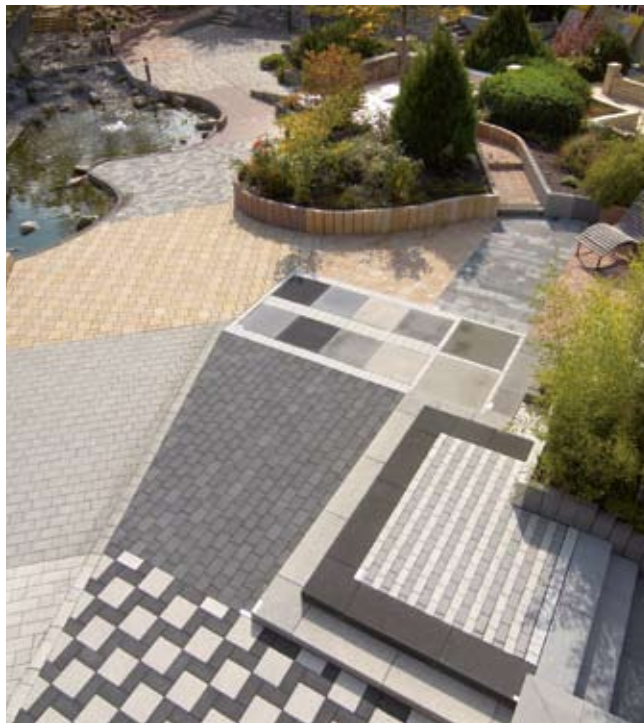
Mustermix und immer wieder gestaltete Gartennischen: der Schaugarten von KANN in Mülheim-Kärlich